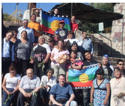
Peregrinación a Sta. Teresita y el Cristo de Rinconada de Silva

Nos gustaría invitar a toda la comunidad católica mapuche de Stgo, a asistir al X encuentro de Mapuches Católicos a realizarse el domingo 6 de Noviembre a partir de las 10 am y hasta las 18 hrs. en la casa de retiro del Verbo Divino en Av. La Florida 8882 (paradero 17 1/2). Este encuentro que se realiza hace muchos años es una oportu-