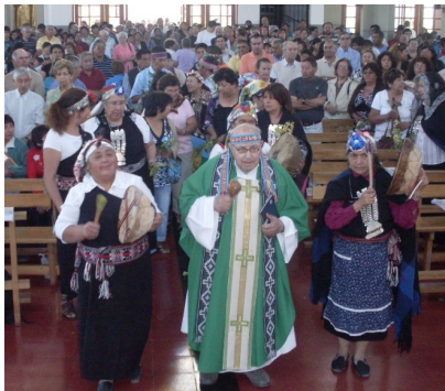
Misa en Santa Teresita de Los Andes

sorprendida y algunos ¡hasta se animan a hacer purrun junto a nosotros! Será también la oportunidad de darnos un pequeño paseo fuera del aire del Santiago waria y que seguro "recargará nuestras pilas" para el año que entra. Si usted está interesado en ir póngase en contacto con la oficina de la pastoral para coordinar cualquier detalle. ¡Ahí nos vemos! ¡Peukallal!