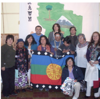
Encuentro de Religiosidad en Junín de los Andes, Argentina.