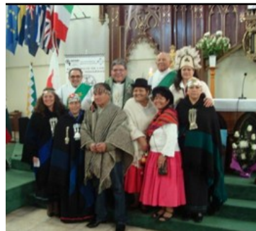
Equipo de Pastoral Indígena de Valparaíso

Chol-Chol que asistían a un Congreso de pueblos indígenas. La pastoral se ubica principalmente en la Parroquia del