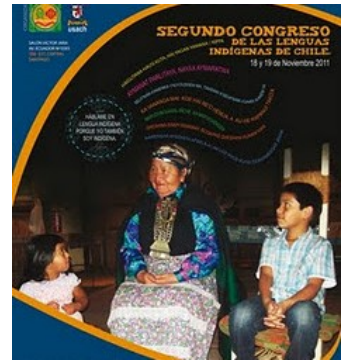
Afiche II Congreso

nes y niños, en las universidades e institutos. La universidad de nuestras vidas ya están abiertas para el estudio y el aprendizaje. Feley pu peñi, feley pu lamngen, kúme rakiduum tukuneaymi tami lonkomew , feymew kúme amuleayíñ"