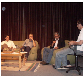
Foro Encuentro con el Pueblo Mapuche